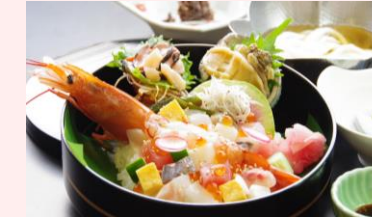
↑ 彩り海鮮丼 (9種)