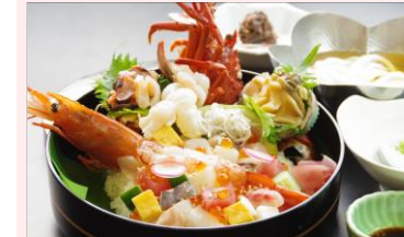
↑ 彩り海鮮丼 (10種)