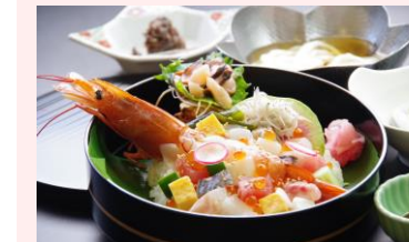
↑ 彩り海鮮丼 (8種)