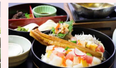
↑ 季節の彩り海鮮丼 (8種)